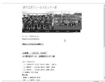
旧神戸ホッケー部ホーム