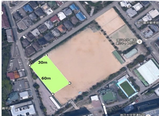
② 発達G縦位置(1/4コート)