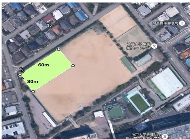
② 発達G横位置(1/4コート)