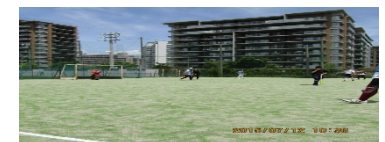
甲南大学ホッケー場