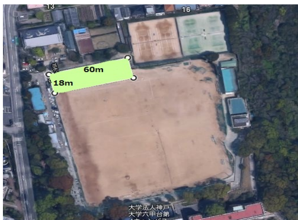
① 六甲台G北側(サークル)