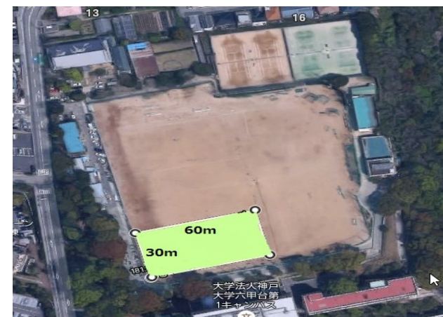
① 六甲台G南側(1/4コート)