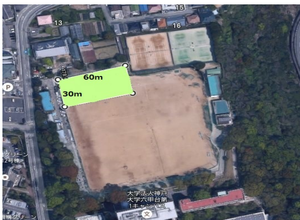
① 六甲台G北側(1/4コート)