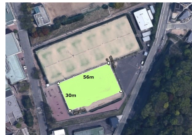
③ 鶴甲Gハンドコート(1/4コート)