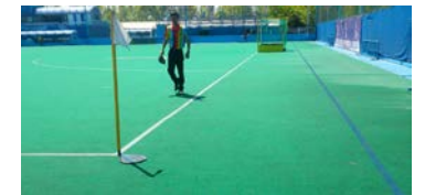
天理大学ホッケー場