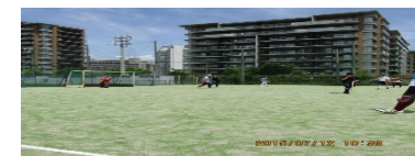
甲南大学ホッケー場