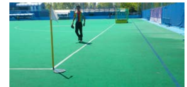
天理大学ホッケー場